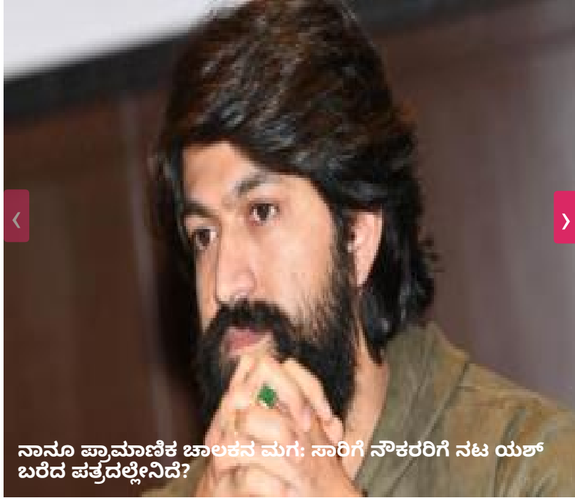
ನಾನೂ ಪ್ರಾಮಾಣಿಕ ಚಾಲಕನ ಮಗ: ಸಾರಿಗೆ ನೌಕರರಿಗೆ ನಟ ಯಶ್ ಬರೆದ ಪತ್ರದಲ್ಲೇನಿದೆ?